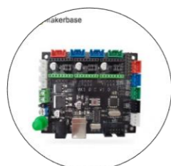
برد کنترل سه محور با خروجی لیزر و فرز