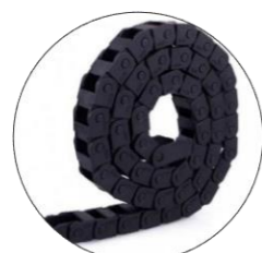
انرژی گاید (محافظ کابل)