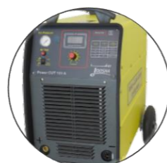
پلاسما Power Cut 101 A-CNC جوشکام الکتریک