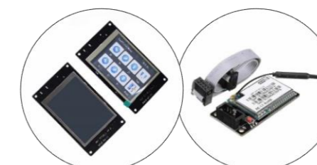
نمایشگر رنگی لمسی ۲ و ۳ اینچ با SD کارت و ماژول WiFi