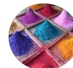
اسکت فلزی مقاوم با ورق ۵ میل مبارک ST52