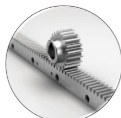
مکانیزم حرکتی دنده شانه ای