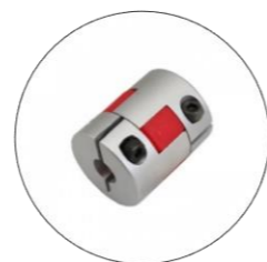
کوپلینگ صنعتی محور عمودی