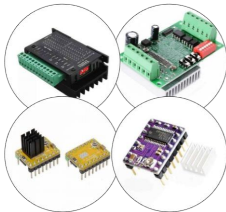
درایور استپر موتور ۱/۱۶ و ۱/۳۲ و ۱/۱۲۸