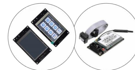
نمایشگر رنگی لمسی ۲ و ۳ اینچ با SD کارت و ماژول WiFi