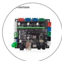
برد کنترل سه محور با خروجی لیزر و فرز