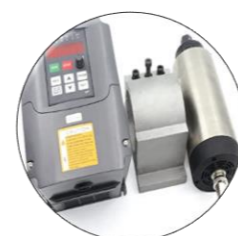
اسپندل AC به همراه اینورتر تکفاز به سه فاز