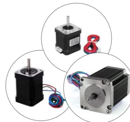
استپر موتور ۹ و ۱۸ کیلو Nema ۱۷ و ۲۳